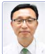
한국심초음파학회 회장 김 완

이번 추계학술대회의 성공적인 개최를 위해서 많은 시간과 열정을 들여 준비 해준 여러 학회 임원들과 관계자들의 노력을 기억하여 주시고, 이들의 수고와 더욱 빛을 발할 수 있도록 회원 여러분의 적극적인 참여를 부탁드립니다.